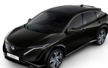
GAT Pearl Black