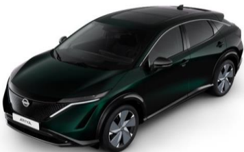
DAP Aurora Green