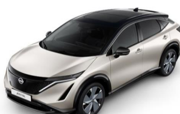
XGV Warm Silver / Black