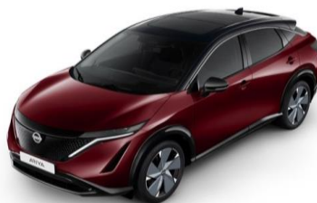
XGG Burgundy / Black