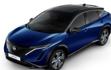
XGU Blue Pearl / Black