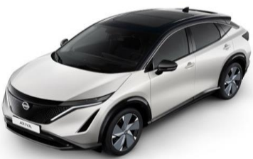
XGA White Pearl / Black