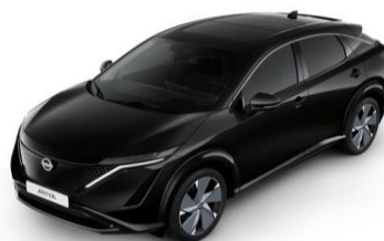
GAT „Pearl Black“