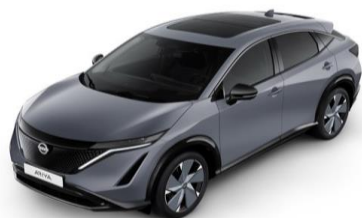
KBY „Ceramic Grey“