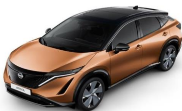
XGJ „Akatsuki Copper/ Black“