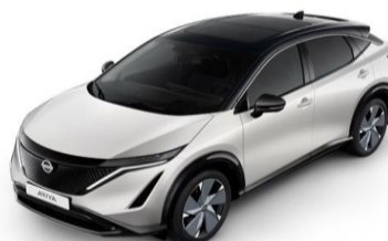
XGA „White Pearl“ / „Black“