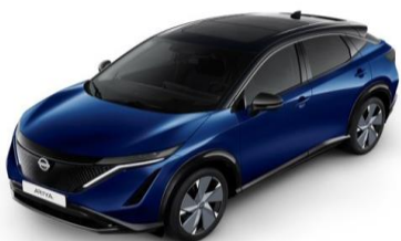
XGU „Blue Pearl“ / „Black“