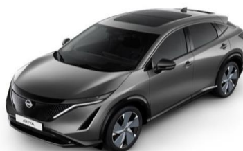
KAD „Dark Metal Grey“