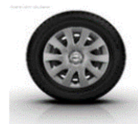
16" stålfälgar med heltäckande navkapslar