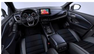
Tekna N-Connecta lisavarustus Sinine ja must - Monoform istmed, tekstiil ja sünteetiline nahk