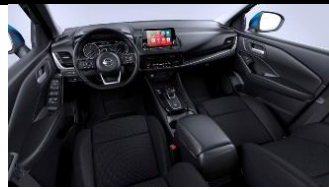
N-Connecta Süsimust - Monoform istmed, tekstiil