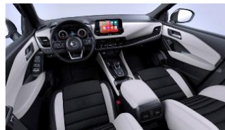
Tekna lisavarustus Helehall - Monoform istmed, tekstiil ja sünteetiline nahk