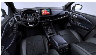
Tekna+ Sinine ja must, Monoform istmed, Nappa nahk