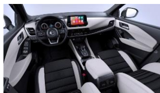
Tekna lisavarustus Helehall - Monoform istmed, tekstiil ja sünteetiline nahk