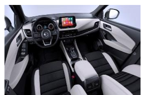
Дополнительно для Tekna Сиденья Monoform, ткань и кожзаменитель, Light Grey