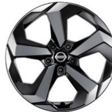
Acenta e-POWER и N-Connecta и Tekna 18-дюймовые легкосплавные диски