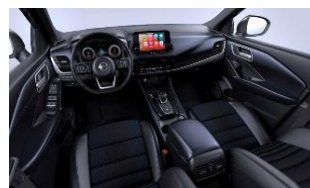
Tekna Sinine ja must - Monoform istmed, tekstiil ja sünteetiline nahk