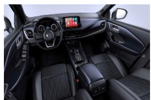
Tekna+ Sinine ja must, Monoform istmed, Premium nahk