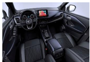
Tekna+ Sinine ja must, Monoform istmed, Premium nahk