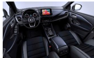
Tekna Sinine ja must - Monoform istmed, tekstiil ja sünteetiline nahk