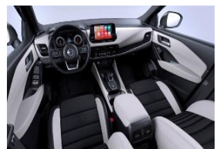
Tekna+ lisavarustus Helehall - Monoform istmed, tekstiil ja sünteetiline nahk