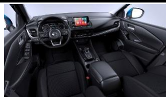
„N-Connecta“ „Monoform“ sėdynės, audinys, „Charcoal“