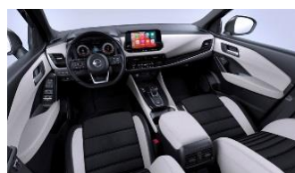
Papildoma „Tekna“ versijos įranga „Monoform“ sėdynės, audinys ir dirbtinė oda, „Light Grey“