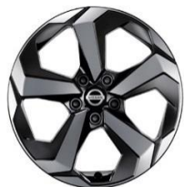
„N-Connecta“ ir „Tekna“ 18 colių „Diamond-Cut“ lengvojo lydinio ratlankiai (235/55 R18)