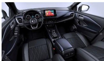
„Tekna+“ „Monoform“ sėdynės, aukštos kokybės oda, „Blue Black“