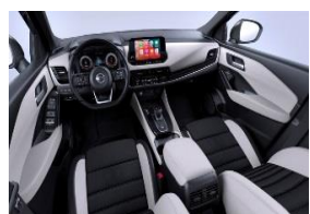
Дополнительно для Tekna+ Сиденья Monoform, ткань и кожзаменитель, Light Grey