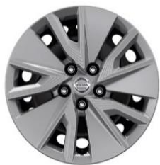
Visia 16-дюймовые стальные диски