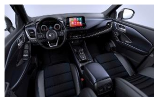
Tekna Sinine ja must - Monoform istmed, tekstiil ja sünteetiline nahk