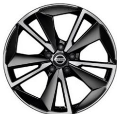
„Tekna+“ Papildoma „N-Connecta“ ir „Tekna“ versijų įranga 19 colių lengvojo lydinio ratrankiai (235/50 R19)