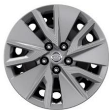
„Visia“ 17 colių plieniniai ratrankiai (215/65 R17)