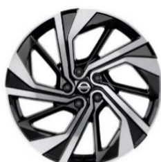
Papildoma „Tekna+“ versijos įranga 20 colių lengvojo lydinio ratrankiai (235/45 R20)