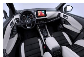
Papildoma „Tekna“ versijos įranga „Monoform“ sėdynės, audinys ir dirbtinė oda, „Light Grey“