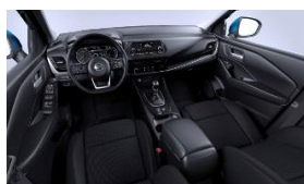
„Visia“ ir „Acenta“ „Monoform“ sėdynės, audinys, „Black“