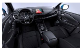
„N-Connecta“ „Monoform“ sėdynės, audinys, „Charcoal“