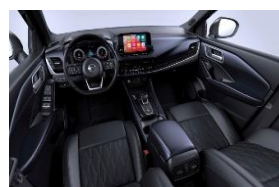
„Tekna+“ „Monoform“ sėdynės, aukštos kokybės oda, „Blue Black“