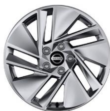
„Acenta“ 17 colių lengvojo lydinio ratrankiai (215/65 R17)