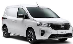
QNG Mineral White