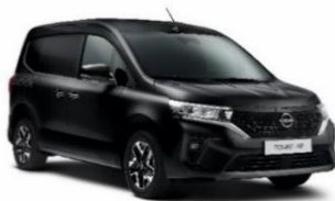
GNE Black Star