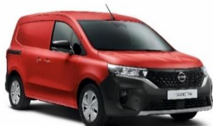
719 Red Magma*