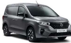
KNG Casiopee Grey