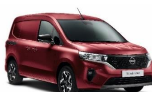
NPF Carmin Red