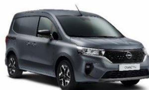
KPW Urban Grey