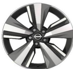
Tekna ja N-Connecta lisavarustuse rattad 19-tollised teemantlõike viimistlusega valuveljed