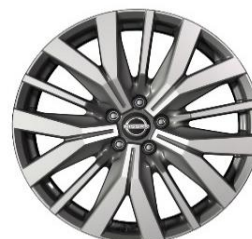
Tekna lisavarustuse rattad 20-tollised teemantlõike viimistlusega valuveljed