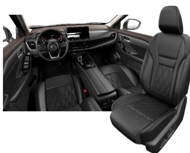
Tekna interjööri valik Must tepingutega kvaliteetnahk