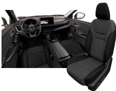
Acenta ja N-Connecta interjööri valik Must tekstiil