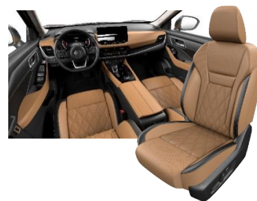
„Tekna“ versijos salonas Aukštos kokybės dygsniuota oda, „Tan“ („e-POWER“ ir „e-4ORCE“)