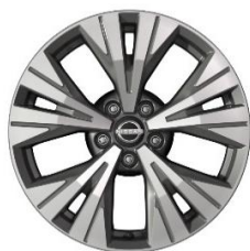
Ratai, skirti „Acenta“ ir „N-Connecta“ versijoms 18" lengvojo lydinio ratlankiai