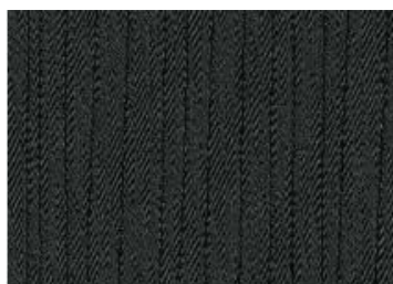
„Acenta“ ir „N-Connecta“ versijų salonas Audinys, „Black“