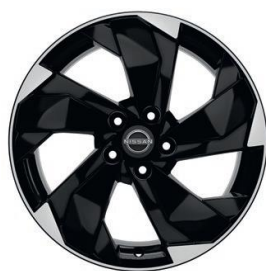
Ratai, skirti „Acenta“ ir „N-Connecta“ versijoms 18" lengvojo lydinio ratlankiai