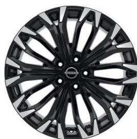
Ratai, skirti „Tekna“ ir „N-Connecta“ versijoms 19" „Diamond-Cut“ lengvojo lydinio ratlankiai