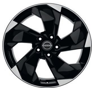
Ratai, skirti „Acenta“ ir „N-Connecta“ versijoms 18" lengvojo lydinio ratlankiai