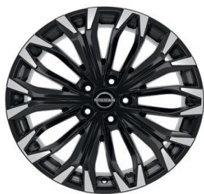
Ratai, skirti „Tekna“ ir „N-Connecta“ versijoms 19" „Diamond-Cut“ lengvojo lydinio ratlankiai