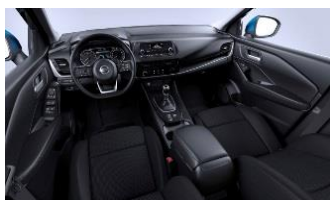
„Visia“ ir „Acenta“ „Monoform“ sėdynės, audinys, „Black“