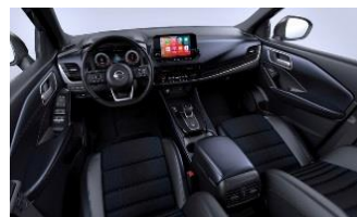
„Tekna“ „Monoform“ sėdynės, dirbtinė oda ir audinys, „Blue Black“