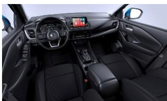
„N-Connecta“ „Monoform“ sėdynės, audinys, „Charcoal“