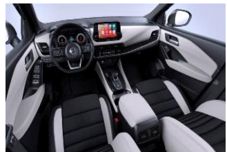
Papildoma „Tekna“ versijos įranga „Monoform“ sėdynės, audinys ir dirbtinė oda, „Light Grey“