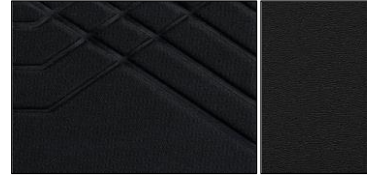
Tekna - melna sintētiskās ādas apdare ar reljefu