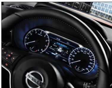
7" krāsains modernais autovadītāja braukšanas palīgsistēmu (ADAD) displejs mērinstrumentu panelī