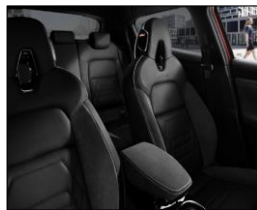
N-Design - melna daļēja ādas un Alcantara apdare