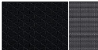
N-Connecta - melna auduma apdare un pelēki akcenti