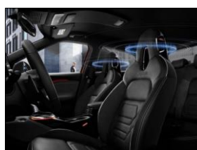
Bose® Personal 360P audio sistēma

Materiālā uzrādītās cenas, aprīkojuma līmeņi un aksesuāru klāsts ir informatīva rakstura, un Nissan patur tiesības veikt izmaiņas bez iepriekšēja brīdinājuma. Viss papildaprīkojums un aksesuāri var nebūt savā starpā kombinējami. Lai uzzinātu jaunāko informāciju, lūdzu, sazinieties ar savu Nissan dīler!