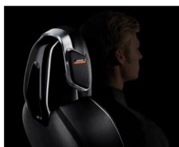
Bose® Personal audio sistēma