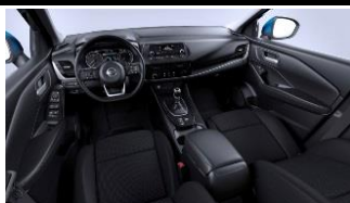
Visia и Acenta Сиденья Monoform, ткань, Black