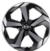
N-Connecta и Tekna 17-дюймовые легкосплавные диски