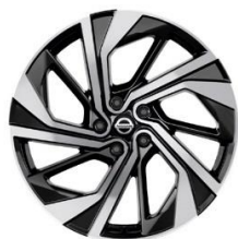
Papildoma „Tekna+“ versijos įranga 20 colių lengvojo lydinio ratlankiai (235/45 R20)