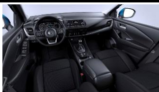
„Visia“ ir „Acenta“ „Monoform“ sėdynės, audinys, „Black“