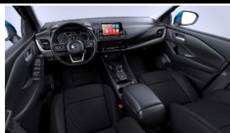
„N-Connecta“ „Monoform“ sėdynės, audinys, „Charcoal“