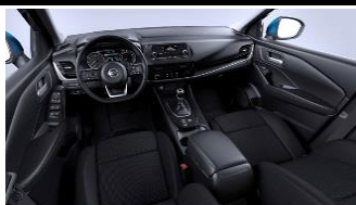
„Visia“ ir „Acenta“ „Monoform“ sėdynės, audinys, „Black“