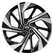
Papildoma „Tekna+“ versijos įranga 20 colių lengvojo lydinio ratlankiai (235/45 R20)