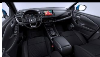
N-Connecta Сиденья Monoform, ткань, Charcoal