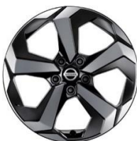
N-Connecta и Tekna 18-дюймовые легкосплавные диски