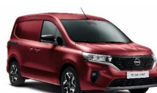
NPF Carmin Red