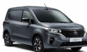
KPW Urban Grey