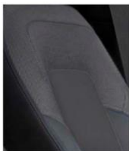
Тканевая обивка сидений — стандарт