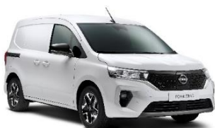
ONG Mineral White