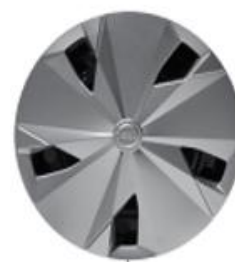
Колпаки на 16" стальные колеса

*Вариант цвета доступен только с черными бамперами. Цвета ориентировочные.