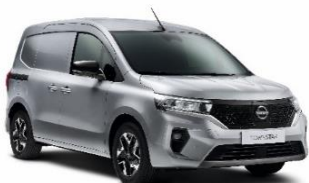
KQA Highland Grey