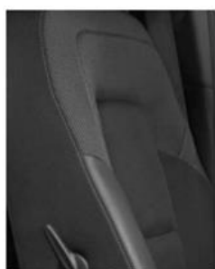
Тканевая обивка сидений — премиум