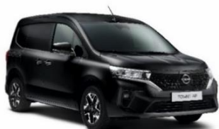
GNE Black Star