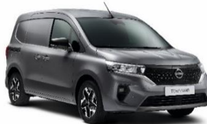
KNG Casiopee Grey