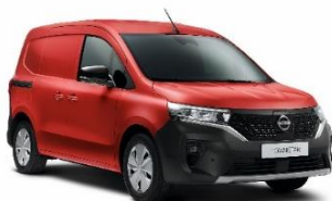
719 Red Magma*